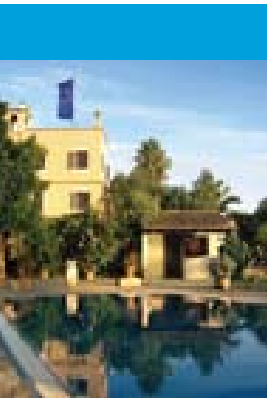
Unterkunft in der Villa Cami de Son Bauló

Ich wünsche uns allen ein vorzügliches Seminar. Ich habe mir große Mühe mit der Wahl des Veranstaltungsortes gemacht. Er sollte abgeschieden, idyllisch, sympathisch und fern der großen Tourismusströme sein. Die Villa Cami de Son Bauló ist genau der richtige Ort dafür. Hier können sich alle rundum Wohl fühlen und die gemeinsame Gesellschaft entspannt genießen. Sollte alles gut und zu allgemeiner Freude gelingen, ist an Fortsetzungen gedacht. Ihr Friedrich Graf.